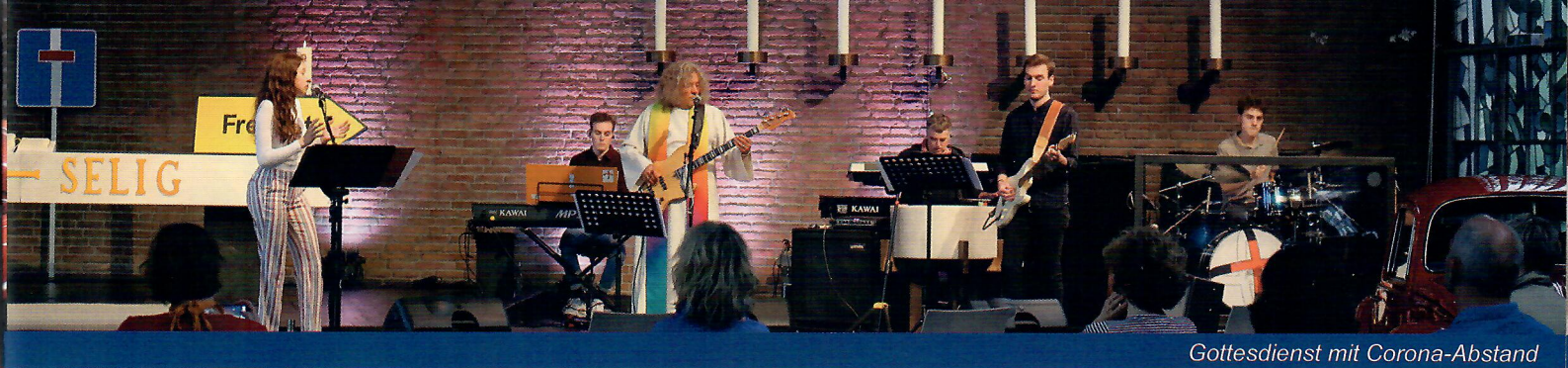
Gottesdienst mit Corona-Abstand

Natürlich nahm sie bei dieser Gelegenheit auch gleich die anderen interaktiven Stationen unter die Lupe – vom Schubladen-Kreuz mit lauter Fragen zum Thema Glück über die Foto-Collage „Heute ist Dein Tag: Was macht Dich glücklich?“ bis zur Hängematte, die zum entspannten Glücklichein einlud.